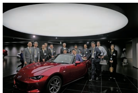
（マツダミュージアム）

午後からはマツダミュージアムを見学し、同社独自の「魂動（こどう）デザイン」やSKYACTIV技術の思想、ヘリテージ車両から最新モデルまでの技術革新の歴史に触れることができた。参加者からは「車を製造する上でのデザインに対する現場の誇りを強く感じた」「段取り替え10分は日本のモノづくりの頂点の一つ」など高い評価の意見が多く寄せられ、極めて有意義な視察となった。