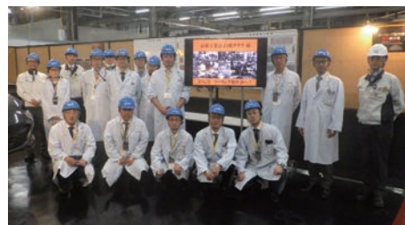
（マツダツーリング制作部）

同社の宇品工場およびマツダミュージアムの視察を行った。まず、会社概要の説明ののち、金型交換を含む高効率な生産ラインと迫力ある大型プレス工程を視察した。その後、ツーリング工程にて、マツダ車製造の思いを具現化する高精度金型技術や段取り替えの迅速化に関する取組を見学、詳細な説明を受けた。